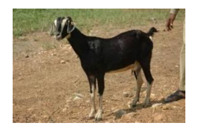
ஆட்டினங்களில் மூலிகை மருத்துவம்