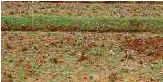
சம உயர வரப்புகள்

மிதமான சரிவு நிலங்களில் சரிவு விகிதம் 6 சதவிகிதத்திற்கு மேற்படாமல் இருக்கும்போது சுமார் 50 விருந்து 80 மீட்டர் இடைவெளியில் சம உயர வரப்புகள் அமைப்பதன் மூலம் மிகுதியான மழைநீரின் பரப்பு நீரோட்டம் குறைக்கப்படுகின்றது. மண் அரிமானம் குறைக்கப்பட்டு மண்ணில் வீர்மண்டல மழைநீர் சேமிப்புத்திறன் அதிகமாகின்றது. சம உயர வரப்புகளை மண்ணை வெட்டி போடுவதன் மூலமாகவோ அல்லது நிலத்தில் பரவிக்கிடக்கும்