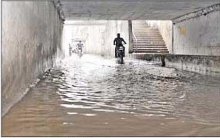
கோவையில் நேற்று பெய்த மழைகாரணமாக வடகோவை மேம்பாலத்தின் கீழ் மழைநீர் தேங்கி நின்ற காட்சி.

சோலையார் அணையில் இருந்து பரம்பிக்குளம் அணைக்கு தண்ணீர் திறப்பது நிறுத்தம்