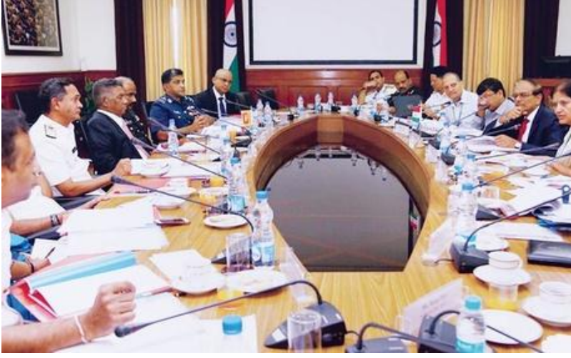
இந்திய - இலங்கை

கடல் எல்லையைத் தாண்டி மீன்பிடிக்க வரும் இரு தரப்பு மீனவர்களை இருநாட்டு கடற்படையோ, கடலோரக் காவல் படையோ தாக்கக் கூடாது என்று தில்லியில் நடைபெற்ற இரு நாடுகளின் பாதுகாப்புத் துறைச் செயலர்கள் கூட்டத்தில் முடிவு செய்யப்பட்டது.