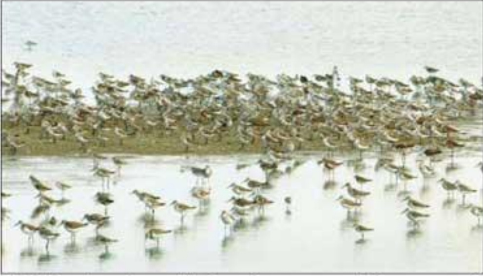
சீசன் தொடங்குவதற்கு முன்பே கோடியக்கரை சரணாலயத்திற்கு வருகை தந்த பறவைகளை படத்தில் காணலாம்.

கோடியக்கரை சரணாலயத்திற்கு வருகை தந்த பறவைகள் மும்பை பறவை ஆராய்ச்சியாளர் தகவல்