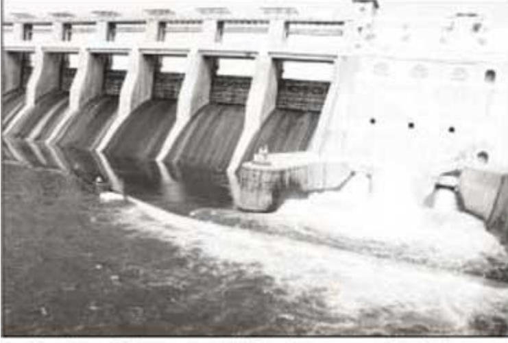
கிருஷ்ணகிரி அணையில் இருந்து வலது மற்றும் இடதுபுற கால்வாய்கள் வழியாக தண்ணீர் வெளியேற்றுவதை படத்தில் காணலாம்

கிருஷ்ணகிரி அணைக்கு நீர்வரத்து தொடர்ந்து அதிகரித்து வருகிறது.